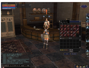
武器や防具は重要なアイテム。資金に合わせて新しいものを買ってこよう。

冒険には危険がつきもの。それらを乗り越えるために不可欠なのが各種アイテムです。アイテムには、身につけることで戦闘力が上がる「装備品アイテム」と異常状態を治癒したり、スキルを覚えるために使う「一般アイテム」、クエストの報酬と交換するために集める「クエストアイテム」の3つの系統があります。「装備品アイテム」と「一般アイテム」は村の店や個人商店で購入できるものもあるので、必要に応じて入手しましょう。