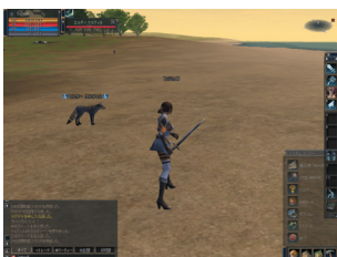
チャットウィンドウに特定のコマンドを打ち込むと、発言する以外の行動も行えます。

『リネージュ』の世界には、あなたの他にもたくさんのプレイヤーが参加しています。チャットを使ってコミュニケーションを図ることで、パーティーを組んだり、アイテムの取引をするなど、さまざまな恩恵があります。チャットウィンドウに文字を入力して色々な人に話しかけ、気の合う仲間を探してみましょう。